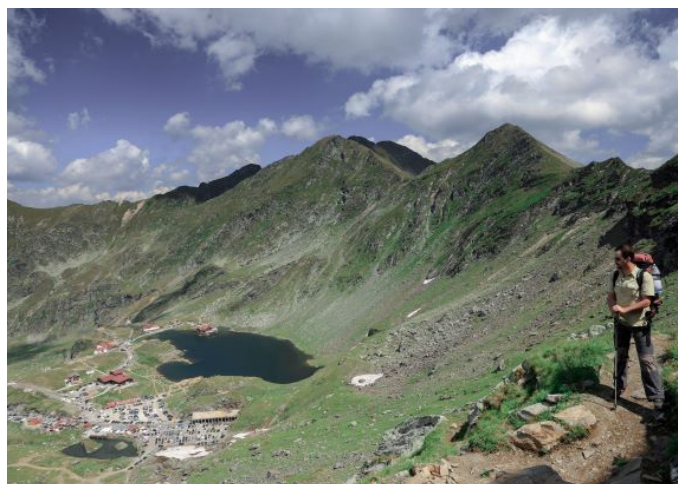
Turistika na hřebenu Fagaraše