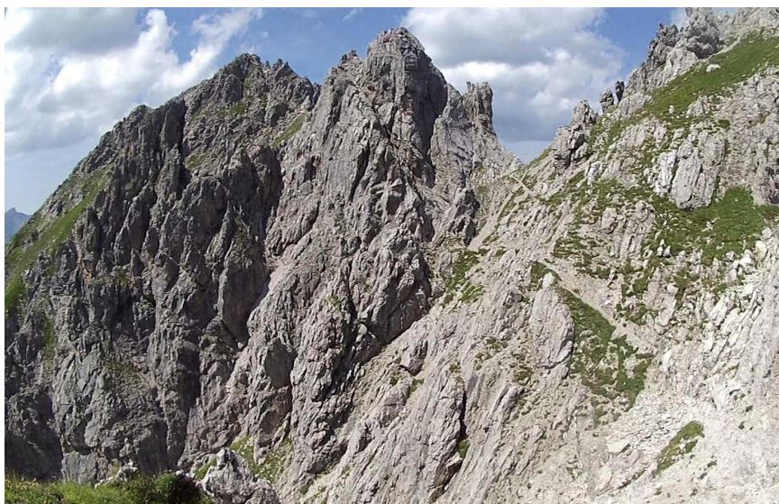
Pohled zpět k sedlu

Z něj podle popisu po červených tečkách vzhůru, nebo traverz v pravém úbočí.