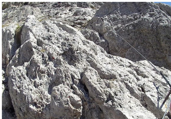
o něco výše