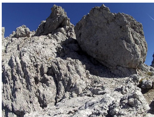
a ještě výše