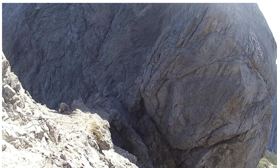
sestup do Böse Scharte