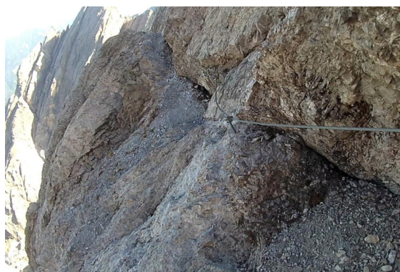
výstup na Kl. Galizenspitze

Odtud sestup opět B/C , výstup na Böses Mandl a sestup snadněji B do Böse Scharte .