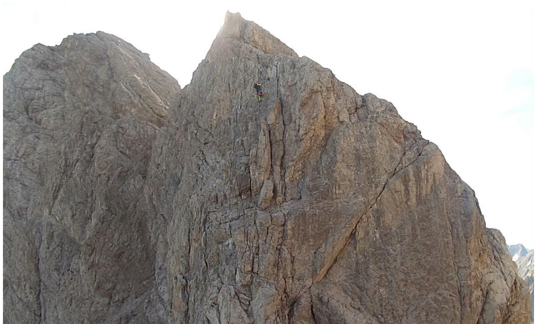
Výstup na Daumen

Zde je opět možný ústup vpravo - suťovité, zajištěno lanem. Ze sedla Böse Scharte vzhůru C – jako obvykle nejtěžší prvý krok – pak podle popisu jedno místo C/D. Výše již snadněji k vrcholu B, dolez C.