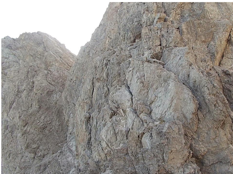
dolní část výstupu na Daumen