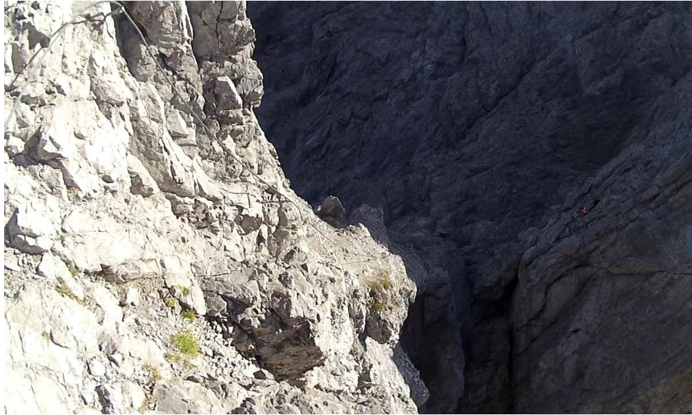
sestup do Böse Scharte

Zde je opět možný ústup vpravo - suťovité, zajištěno lanem. Ze sedla Böse Scharte vzhůru C – jako obvykle nejtěžší prvý krok – pak podle popisu jedno místo C/D. Výše již snadněji k vrcholu B, dolez C.