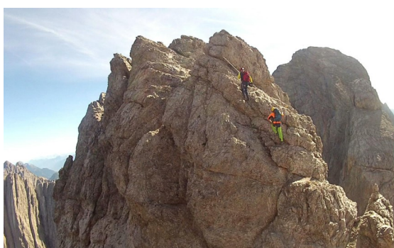
Výstup na Böses Mandl

Odtud sestup opět B/C , výstup na Böses Mandl a sestup snadněji B do Böse Scharte .