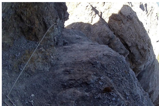
výstup na Kl. Galizenspitze – pohled zpět