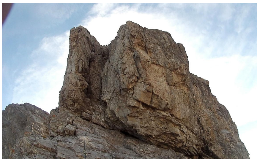
horní část výstupu na Dumen

Sestup s vrcholu krásné špičky Daumen na druhou stranu je opět B, C.