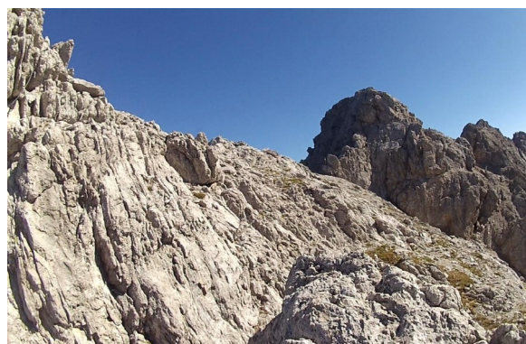
obcházíme vrchol Gr. Laserzkopf